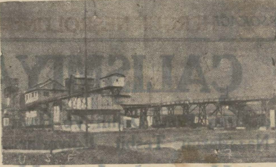
Alpulu Şeker Fabrikası